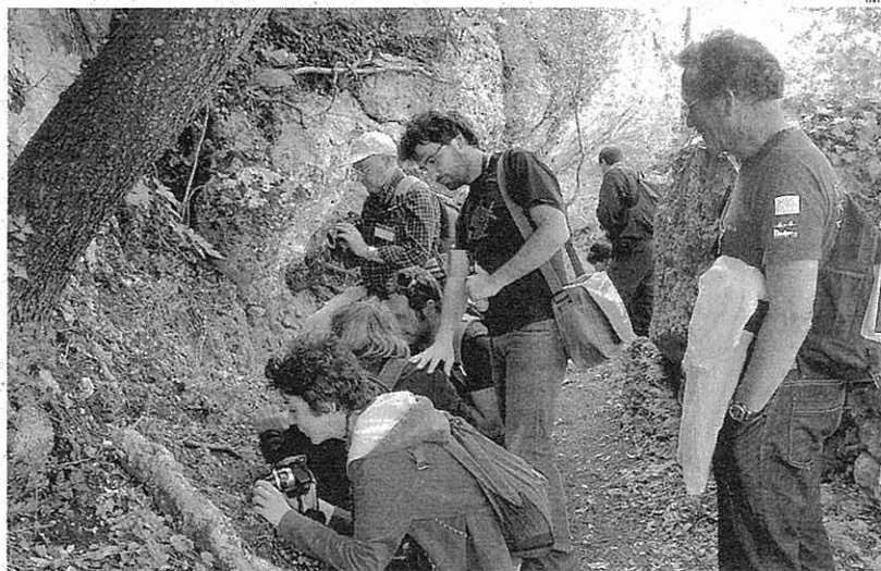
EXCURSIÓN. Los participantes de las jornadas científicas han fotografiado la flora de la Isla

Las aportaciones científicas de los más de 70 asistentes procedentes de diferentes países de la cuenca mediterránea se refirieron a las islas mediterráneas como refugio de muchas especies únicas y territorios clave para la salvaguarda de la biodiversidad global. Las ponencias versaron sobre territorios tan diversos como Chipre, Creta, Córcega, Sicilia, Cerdeña, Islas Jónicas, Islas Toscanas, Islas Habibas, Islas Columbretes y Balears, entre otras. Las islas mediterráneas comparten muchas de las amenazas y dificultades relacionadas con la conservación de la flora, por lo que